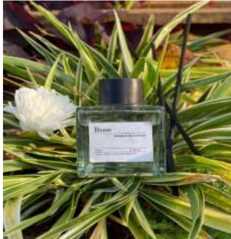
Gambar 11. Hasil Produk dan Packaging

28 September 2025 di Balai Dusun Cikopo, Desa Cibinuang, dengan mengundang narasumber dari PLUT–KUMKM, yaitu Bapak Agah Purnama, S.Si. Peserta belajar secara langsung cara membuat desain kemasan kreatif, termasuk label, warna, dan branding produk, serta membuka akun bisnis di Shopee, Instagram, dan TikTok sebagai media pemasaran online yang efektif dalam memperluas jangkauan pasar (Haromin et al., 2020; Limbong et al., 2021). Setelah pendampingan, peserta mampu memasarkan produk melalui media sosial dan e-commerce secara mandiri.