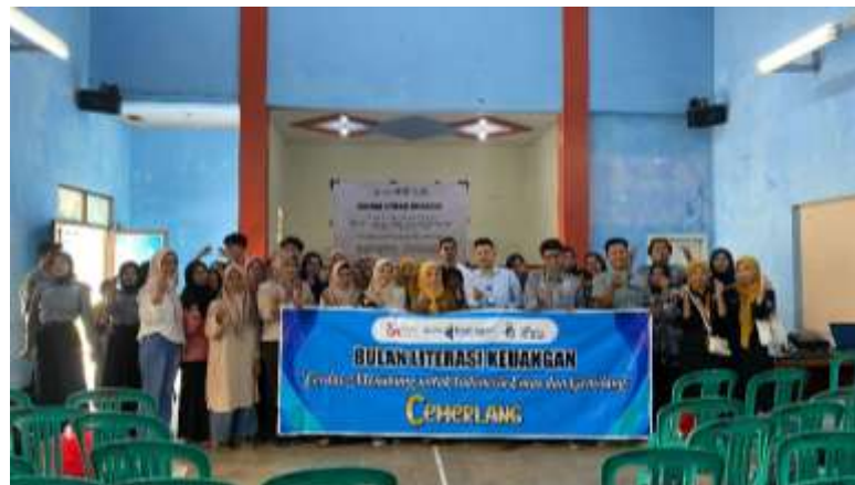
Gambar 7 Seminar Literasi Keuangan

Kegiatan literasi keuangan difokuskan pada peningkatan kemampuan mitra dalam melakukan pembukuan sederhana sebagai dasar pengelolaan usaha. Tim PPK Ormawa menghadirkan pemateri dari Bank Kuningan untuk memberikan pelatihan terkait pencatatan pemasukan dan pengeluaran, pengelolaan kas, serta pentingnya laporan keuangan. Diharapkan, mitra mampu menerapkan pembukuan secara mandiri guna mengelola anggaran secara lebih optimal.