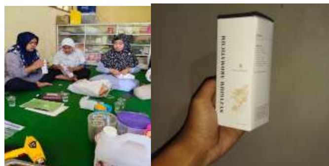
Gambar 6 Proses Pengemasan dan Foto Kemasan

Pengemasan dan pemasaran digital menjadi fokus dalam meningkatkan daya saing produk scent diffuser . Tim PPK Ormawa menghadirkan pemateri dari PLUT KUMKM untuk memberikan pelatihan teknik pengemasan menarik dan strategi e-commerce , agar kelompok sasaran mampu memasarkan produk secara lebih luas dan efektif.