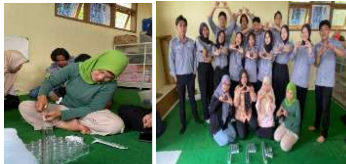
Gambar 5 Pendampingan

Pendampingan produksi dilakukan untuk meningkatkan kemampuan mitra dalam mengolah produk secara mandiri. Kegiatan ini mencakup pemilahan daun cengkih, penyulingan, dan peracikan scent diffuser , dengan arahan langsung kepada anggota KWT An-Nisa. Melalui pendampingan ini, proses produksi diharapkan berjalan lebih terstandar, efisien, dan berkelanjutan.