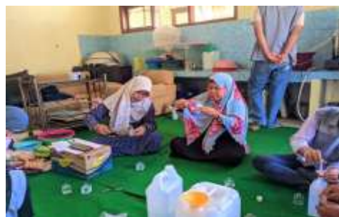
Gambar 10. Pelatihan dan Pendampingan

Inovasi produk scent diffuser berbahan dasar daun cengkih dikembangkan sebagai solusi pengolahan limbah perkebunan menjadi produk bernilai jual. Produk ini bermanfaat dalam menciptakan aroma ruangan yang segar, membantu relaksasi, mengurangi stres, serta memiliki sifat antibakteri yang dapat meningkatkan kualitas udara dalam ruangan. Pelatihan dilaksanakan secara rutin dua kali dalam seminggu (Jumat–Sabtu) dan diikuti oleh 10–15 ibu rumah tangga. Peserta diberikan pelatihan mulai dari seleksi bahan baku, proses ekstraksi aroma, formulasi, pencampuran bahan tambahan, hingga teknik pengemasan agar produk memiliki mutu yang baik, aroma stabil, dan tampilan kemasan menarik sehingga layak masuk pasar modern (Tasijawa et al., 2023).