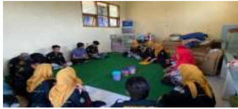
Gambar 4 Perizinan dan Penetapan Rumah produksi

dan ketua KWT An-Nisa, serta ditandai dengan penandatanganan MoU sebagai bentuk kesepakatan resmi penggunaan dan pengelolaan rumah produksi.