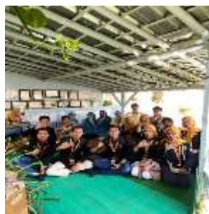
Gambar 1 FGD bersama KWT An-Nisa

Dalam tahap identifikasi potensi dan permasalahan, tim PPK Ormawa melakukan serangkaian kegiatan untuk memastikan kondisi nyata di lapangan. Proses dimulai dengan melakukan wawancara bersama Kepala Desa Cibinuang guna menggali informasi mengenai situasi desa, potensi yang dimiliki, serta permasalahan yang dihadapi masyarakat. Setelah itu, tim melakukan validasi potensi melalui observasi langsung ke perkebunan cengkih yang menjadi salah satu sumber daya utama desa. Setelah hasil observasi dinyatakan sesuai, tim melanjutkan kegiatan dengan melakukan koordinasi bersama KWT An-Nisa sebagai kelompok sasaran. Selanjutnya, dilakukan Focus Group Discussion (FGD) untuk mengetahui tingkat pemahaman kelompok sasaran mengenai pemanfaatan potensi desa dan menggali lebih jauh kebutuhan mereka dalam upaya peningkatan kesejahteraan.