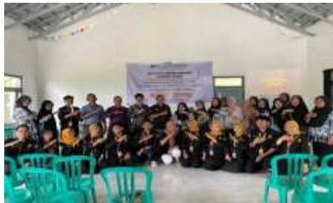
Gambar 9. Sosialisasi dan Pembukaan Program

Kegiatan pengabdian kepada masyarakat melalui Gerakan Desa Wirausaha di Desa Cibinuang menghasilkan luaran nyata yang berdampak langsung terhadap peningkatan kapasitas dan kemandirian ekonomi masyarakat. Tahapan pelaksanaan kegiatan dimulai dari sosialisasi, pelatihan dan pendampingan, literasi keuangan, penyelenggaraan Expo Raya Cibinuang, hingga fasilitasi legalitas usaha. Sosialisasi Gerakan Desa Wirausaha dilaksanakan di Balai Desa Cibinuang dan diikuti oleh 20 peserta. Kegiatan ini bertujuan untuk menumbuhkan motivasi dan pemahaman dasar mengenai pentingnya jiwa kewirausahaan sebagai langkah awal dalam membangun kemandirian ekonomi (Wulandari & Sari, 2021). Pada tahap ini, masyarakat diperkenalkan potensi pengolahan limbah daun cengkih menjadi produk bernilai ekonomi sebagai alternatif wirausaha berbasis potensi lokal.