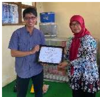
Gambar 3 Penetapan kelompok diwakili Ketua KWT An-Nisa

Pada tahap pelaksanaan, tim menetapkan KWT An-Nisa sebagai kelompok usaha sasaran dan mengurus legalitasnya melalui penandatanganan sertifikat kerja sama, agar memiliki dasar hukum yang jelas dalam menjalankan program.