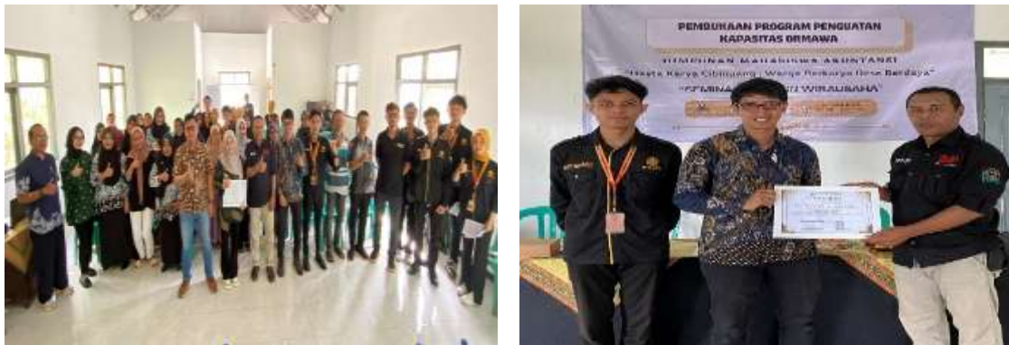
Gambar 2 Sosialisasi Desa Wirausaha

Sosialisasi Desa Wirausaha bertujuan meningkatkan minat dan motivasi masyarakat dalam berwirausaha. Melalui gerakan HASABI (Hasta Karya Cibinuang), tim mendorong pemanfaatan daun cengkih menjadi produk bernilai jual tinggi untuk membuka peluang usaha dan meningkatkan ekonomi keluarga. Kegiatan ini dilaksanakan dalam bentuk seminar bersama narasumber dari Dinas Ekonomi Kreatif (Ekraf), yang memberikan wawasan tentang peluang usaha berbasis potensi lokal dan strategi pengembangan produk dalam membangun desa wirausaha.