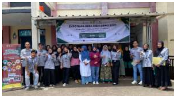
Gambar 8 Expo Raya Cibinuang

Expo Raya Cibinuang menjadi momen puncak dalam memperkenalkan produk scent diffuser kepada masyarakat. Ibu-ibu KWT An-Nisa menampilkan demonstrasi langsung proses produksi, dari pengolahan bahan hingga hasil akhir. Acara ini juga dimeriahkan dengan bazar murah dan berbagai perlombaan warga. Melalui kegiatan ini, produk KWT semakin dikenal dan dukungan masyarakat terhadap usaha lokal semakin kuat.